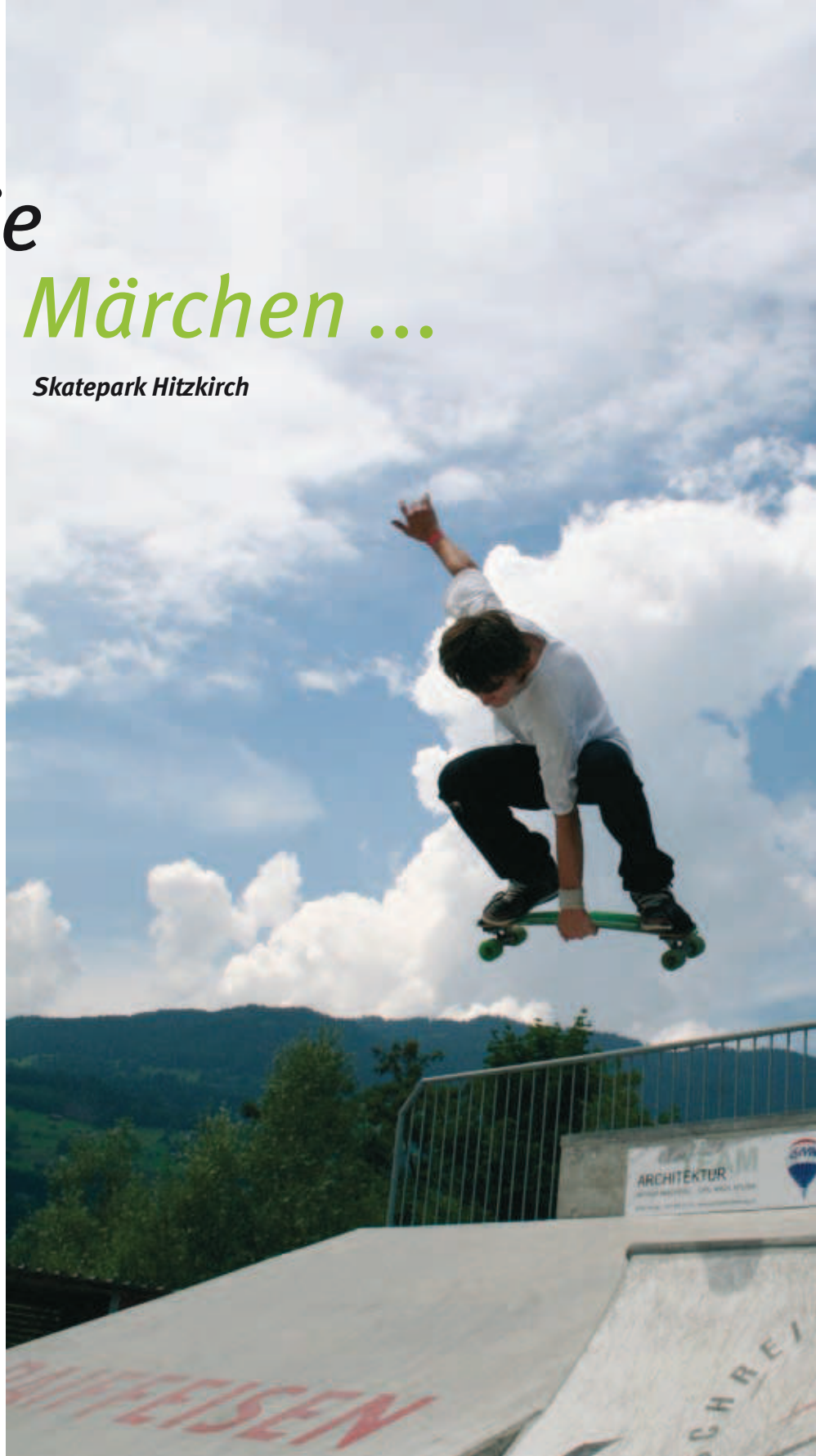
Schon bald auch in Hitzkirch möglich: Höhenflüge auf dem Skateboard.